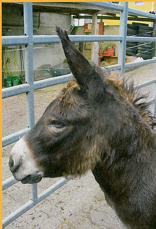
Esel Benjamin sucht ein neues Zuhause.

Benjamin, Veilchens fünfzehnjähriger Sohn hingegen hat ein ganz anderes Problem: Er ist übergewichtig und muss vorsichtig abspecken, sonst ist er ganz gesund. „Würden wir das